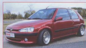
Tuning: Peugeot 106