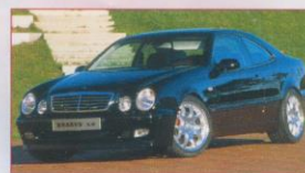
Tuning: Mercedes CLK