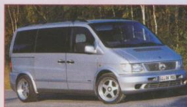
Tuning: Mercedes Vito