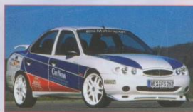
Tuning: Ford Mondeo