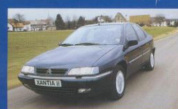
Citroën Xantia II