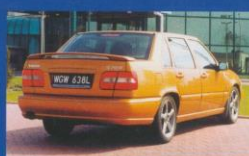
Volvo S70 R