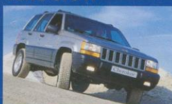
Jeep Grand Cherokee