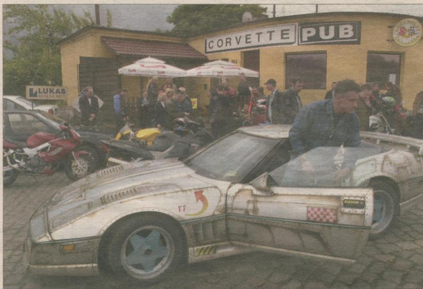
W pubie Corvette w Szczecinie zbierają się fani motoryzacji. Będą również obecni w trakcie AUTO SALON SHOW.