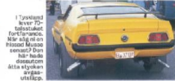
I Tyskland lever 70-talsstuket fortfarande. När såg vi en bilad Mustang senast? Den här hade dessutom åtta stycken avgas- utsläpp.

gott exempel och klände i sig för dåliga kryddurka bearbetning och lite grillad kyckling.