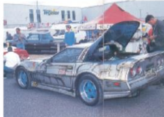
Corvette med påskars! Sjåaren UB den här tiden som från Polen och hade fått till en till och med- boken. Karossen såg ut som den var sammansatt av en mängd hop-sprutade påskbitar.