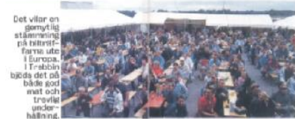
Det vilar en gemytlig stämning på bilträffarna ute i Europa. I Trebbin bjuds det på både god mat och trevlig underhållning.