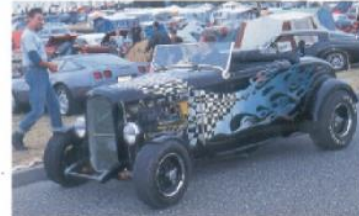
Roadster är ingen vanlig syn i Tyskland. Den här Ford Roadster sågs köra runt desto mera — till alla förbasser.