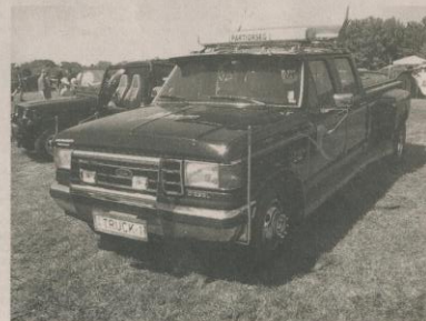
Półciężarówka „ford F350” przyjechała do Radomia z Węgier.