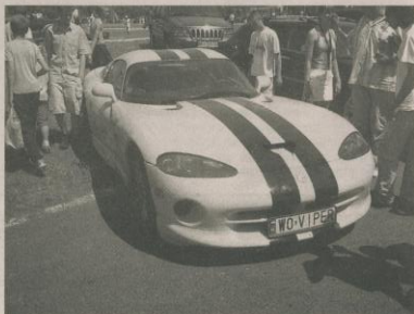
Na zlocie nie mogło zabraknąć współczesnych aut, jak „dodge viper”.